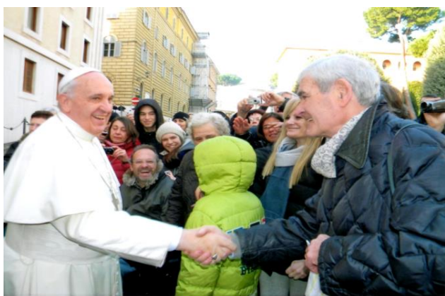
L'11 gennaio 2014 incontro con Papa Francesco